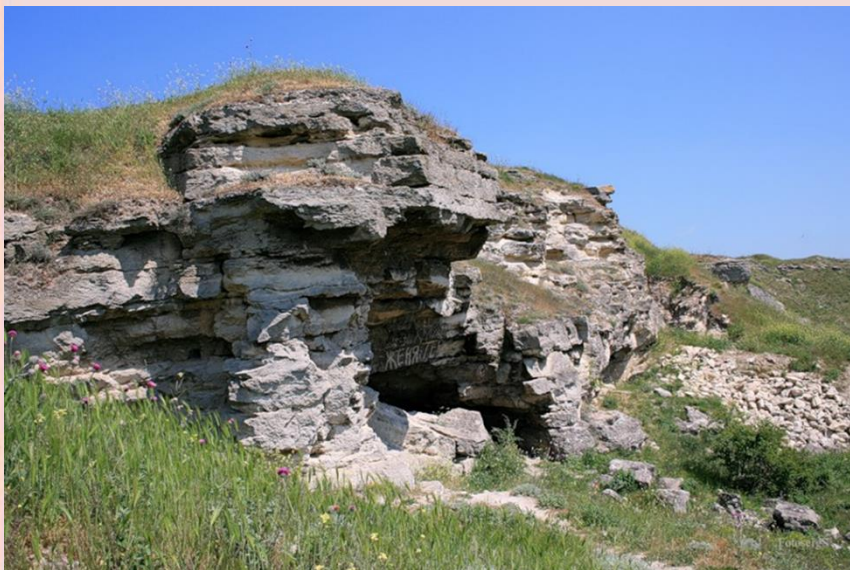
Один из входов в каменоломню

Аджимушкайские каменоломни тянутся под землей на многие десятки километров. Это настоящее подполье, подземный мир, в лабиринтах которого скрывались бойцы Красной Армии, оказывающие сопротивление фашистам. Появились каменоломни еще в древние времена.