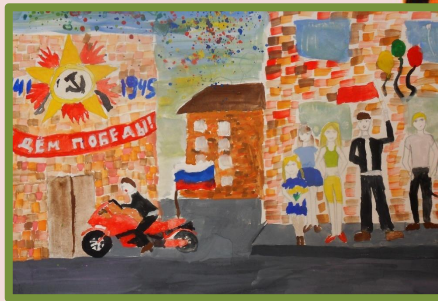
Оверченко Валерия, 6в