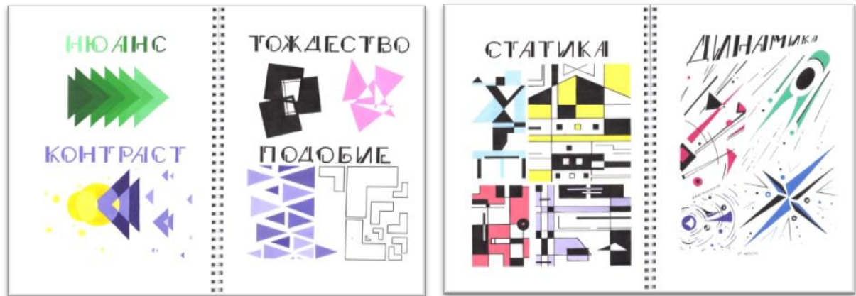
Рисунок 2. Формальная композиция. Моторина В., 9 класс.

идеализированных реальных материальных объектов в сознании человека. В математике отсутствует мера измерения длины линий» 1 .